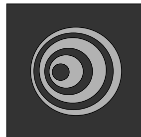
Figura 4. Patrón de una estrella en un telescopio sin colimar.