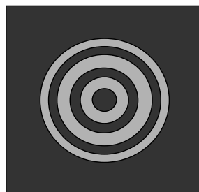
Figura 3. Patrón de una estrella en un telescopio colimado.